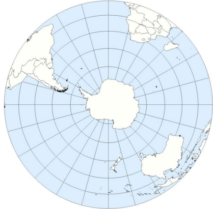
Carte polaire de l'hémisphère Sud