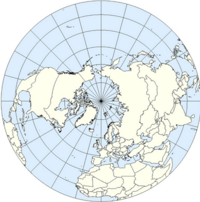
Carte polaire de l'hémisphère Nord