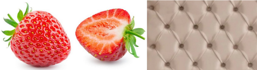
Fig. 9.112 : Visions métaphoriques de l'architecture « extérieure » des atomes

Les akènes , qui sont les véritables fruits du fraisier, sont légèrement incrustés dans la peau de la fraise et la coupe nous montre comment ils sont reliés au centre du corps charnu. Nous obtenons ainsi une image des électrons, des puits de potentiel et des noyaux atomiques. Les boutons de capitonnage utilisés en ameublement nous donnent une autre vision métaphorique de la « peau » d'un atome.